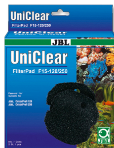
JBL FilterPad F15 Espuma de poro grueso para el filtro CristalProfi