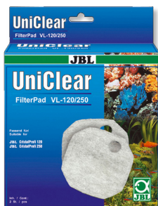
JBL FilterPad VL Filtro de algodón para filtros CristalProfi