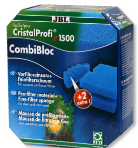
JBL CombiBloc CristalProfi e Material prefiltrante y espuma para CristalProfi e