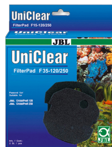
JBL FilterPad F35 Espuma de poro fino para el filtro CristalProfi